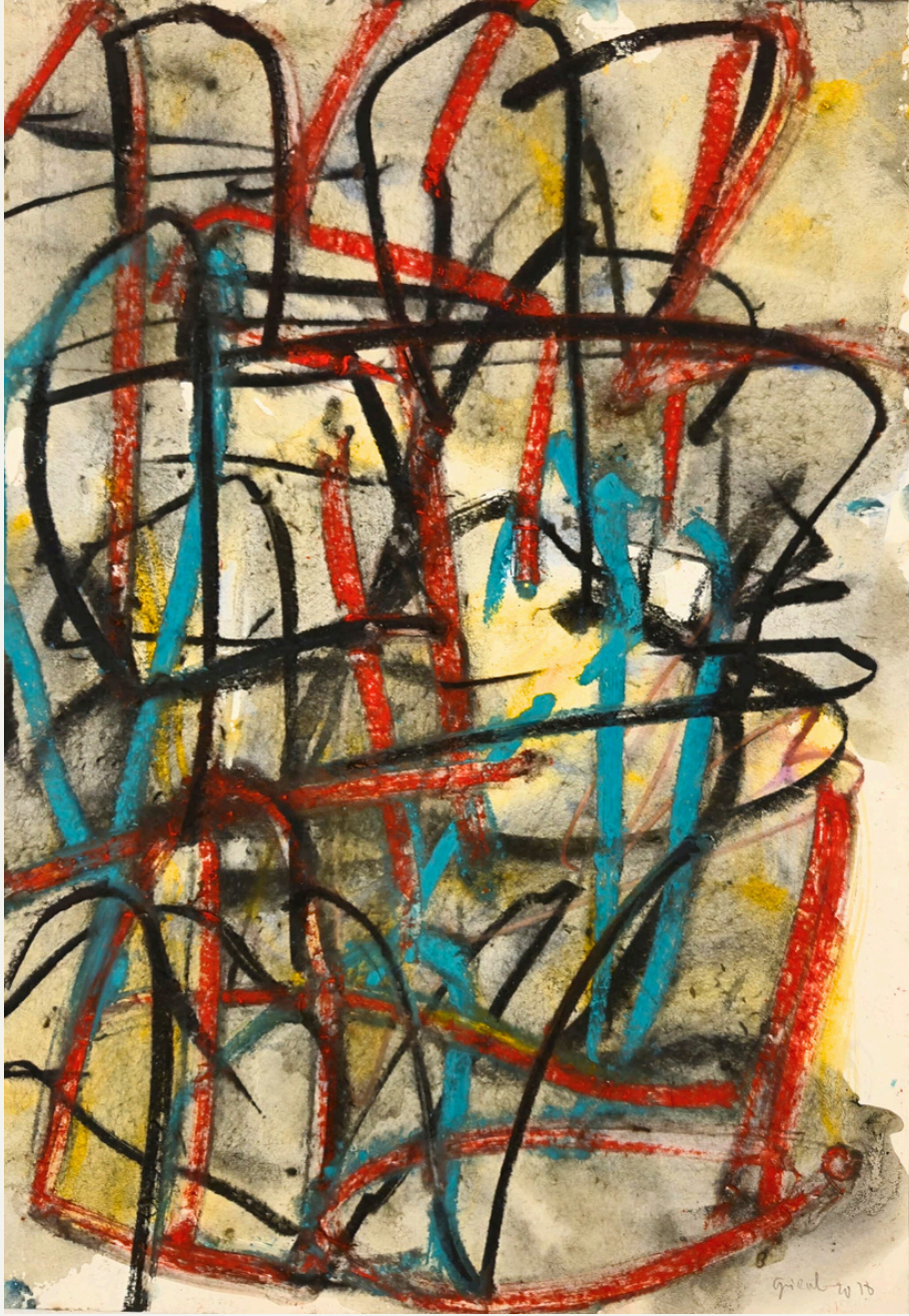
42x30 cm / kağıt üzeri karışık teknik / 2018 12000 TL