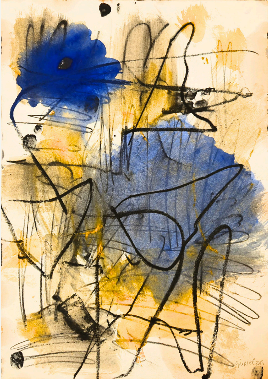
42x30 cm / kağıt üzeri karışık teknik / 2018 12000 TL