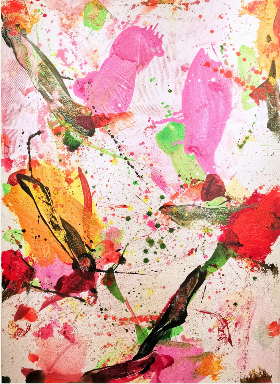
105x76 cm / kağıt üzeri karışık teknik / 2013 60000 TL