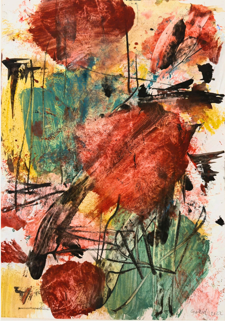
42x30 cm / kağıt üzeri karışık teknik / 2022 12000 TL