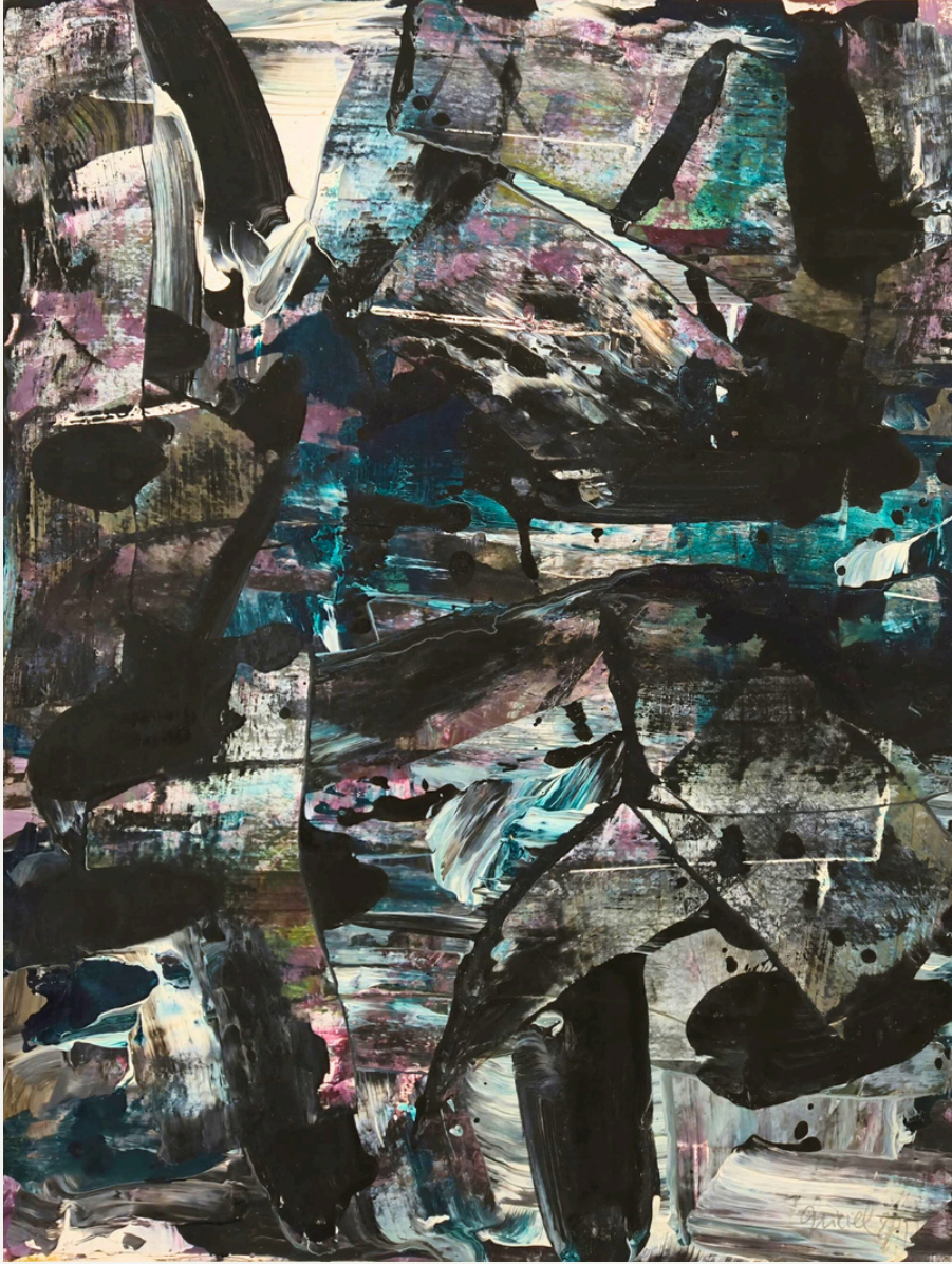
35x27 cm / kağıt üzeri karışık teknik / 2018 12000 TL