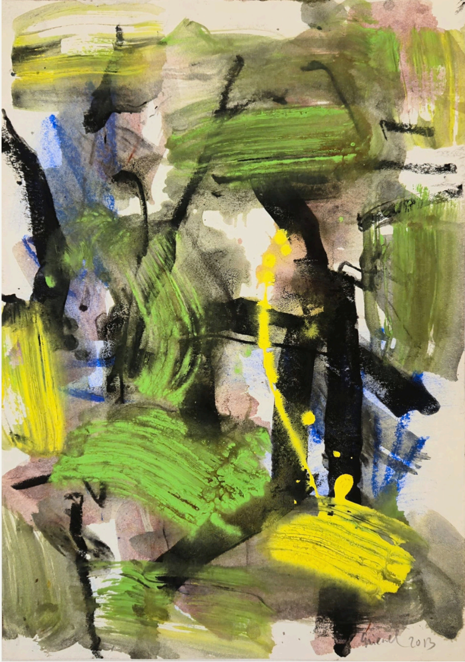
30x21 cm / kağıt üzeri karışık teknik / 2013 10000 TL