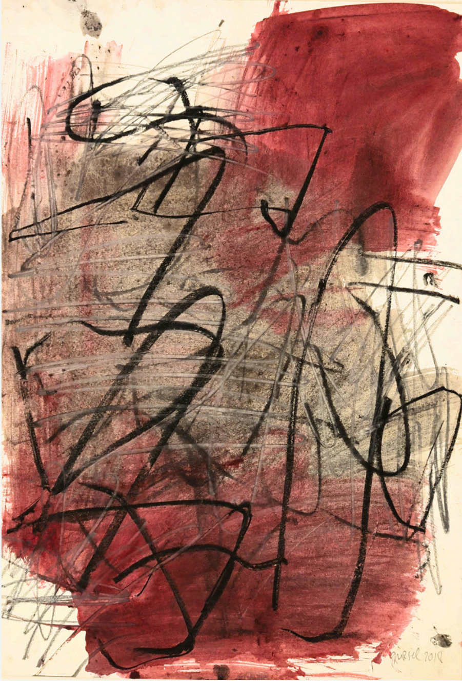
42x30 cm / kağıt üzeri karışık teknik / 2018 12000 TL