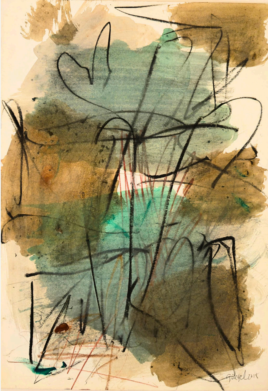
42x30 cm / kağıt üzeri karışık teknik / 2018 12000 TL