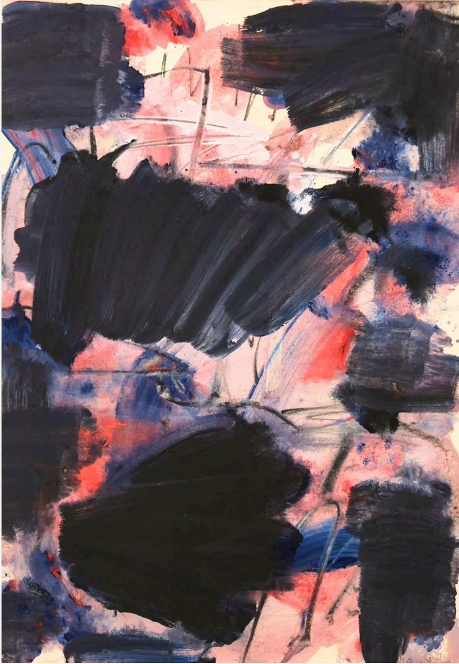
42x30 cm / kağıt üzeri karışık teknik / 2018 12000 TL