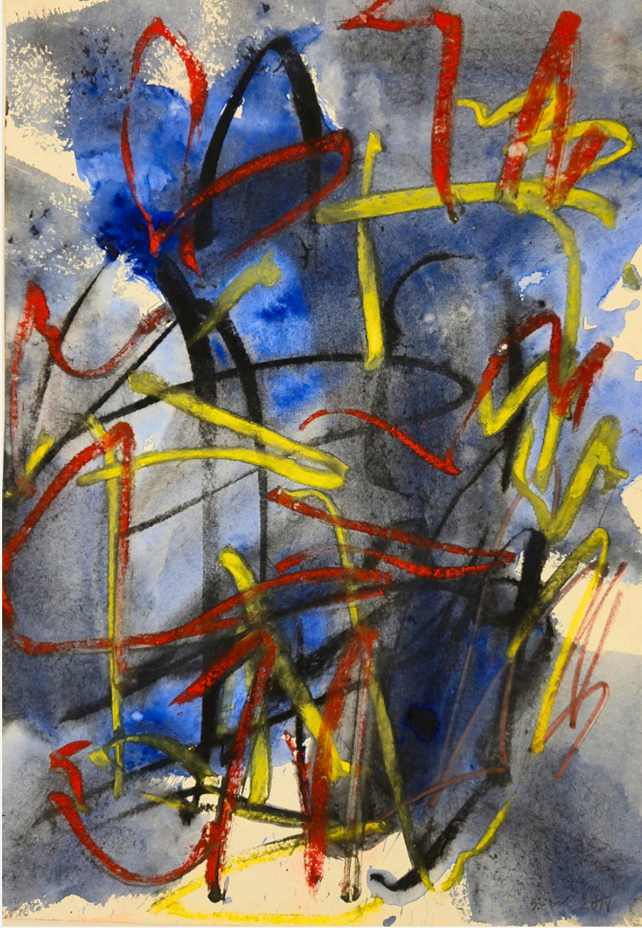
42x30 cm / kağıt üzeri karışık teknik / 2018 12000 TL