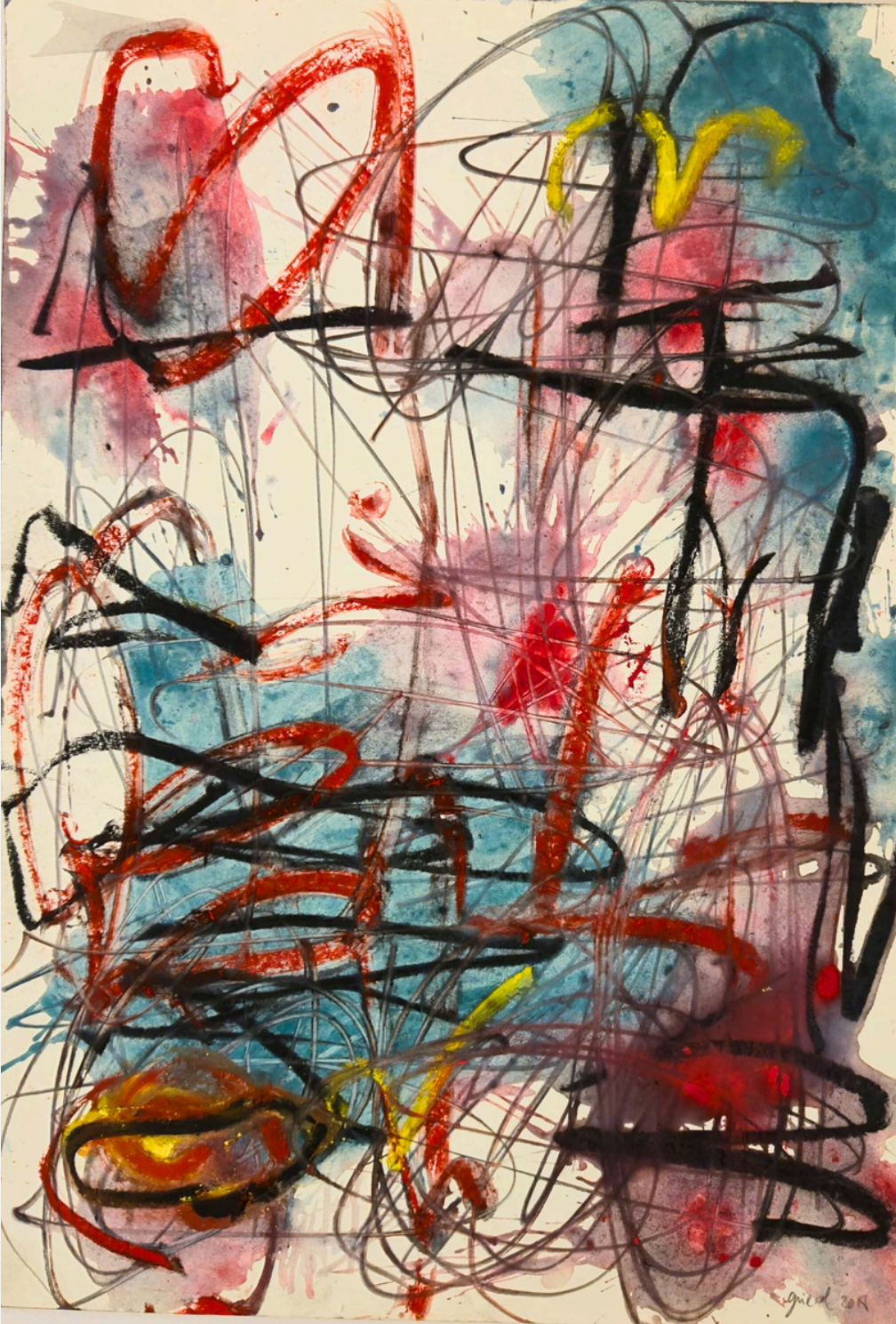
42x30 cm / kağıt üzeri karışık teknik / 2018 12000 TL