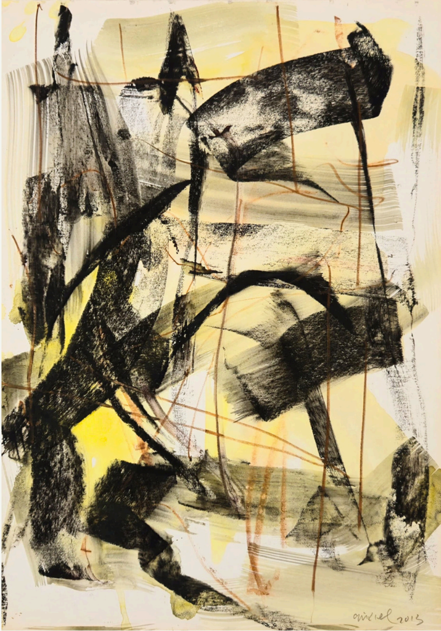
31x22 cm / kağıt üzeri karışık teknik / 2013 10000 TL