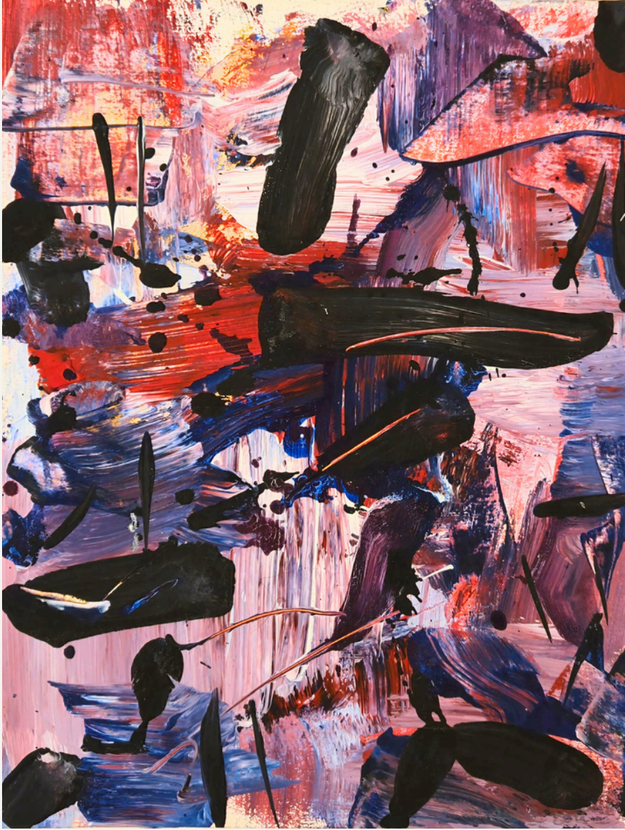
35x27 cm / kağıt üzeri karışık teknik / 2015 12000 TL