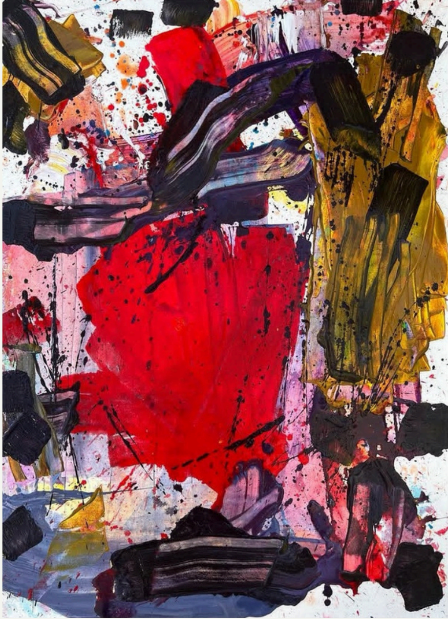
76x56 cm / kağıt üzeri karışık teknik / 2022 30000 TL