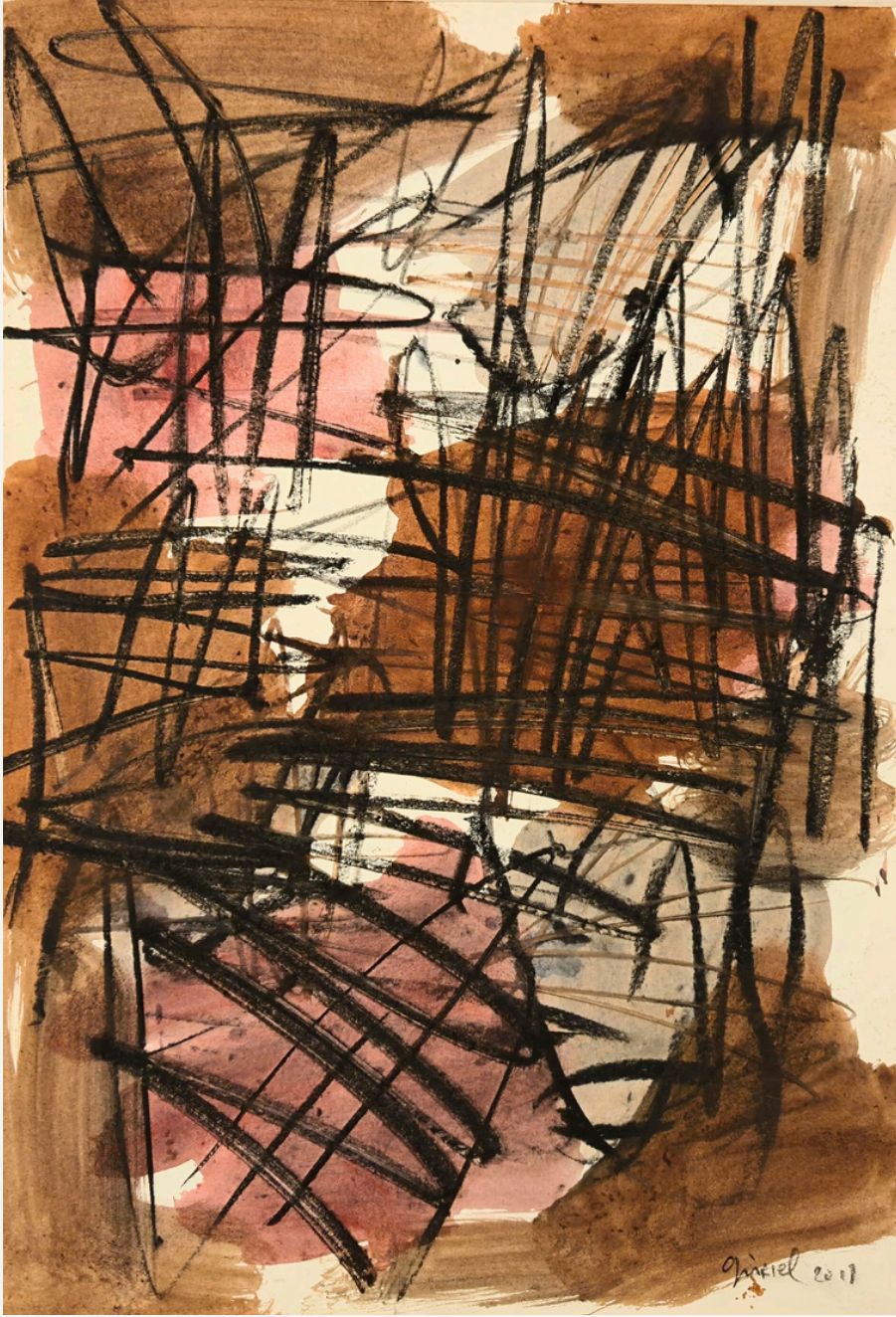
42x30 cm / kağıt üzeri karışık teknik / 2018 12000 TL